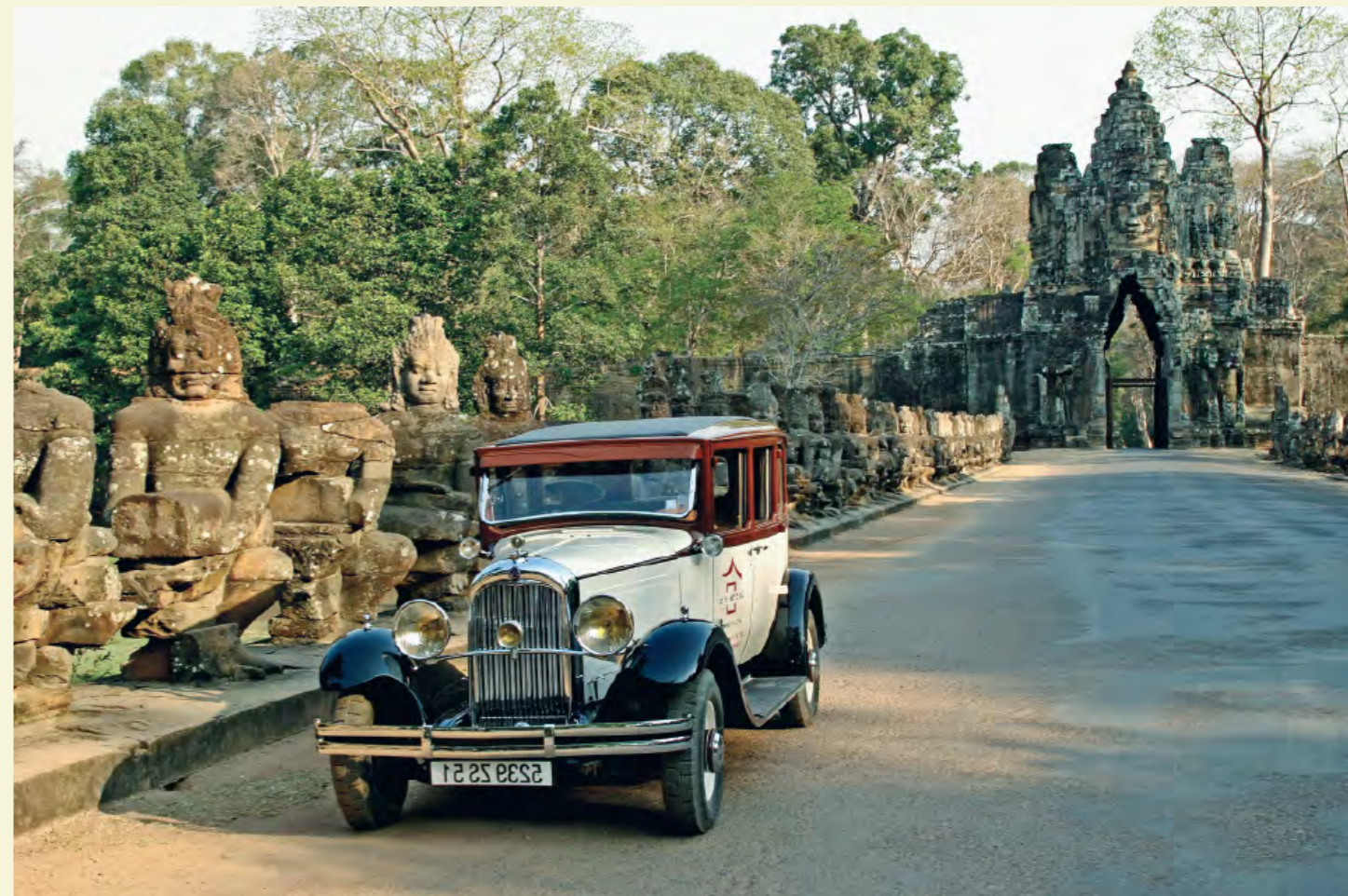
CITROEN D'ÉPOQUE VICTORIA