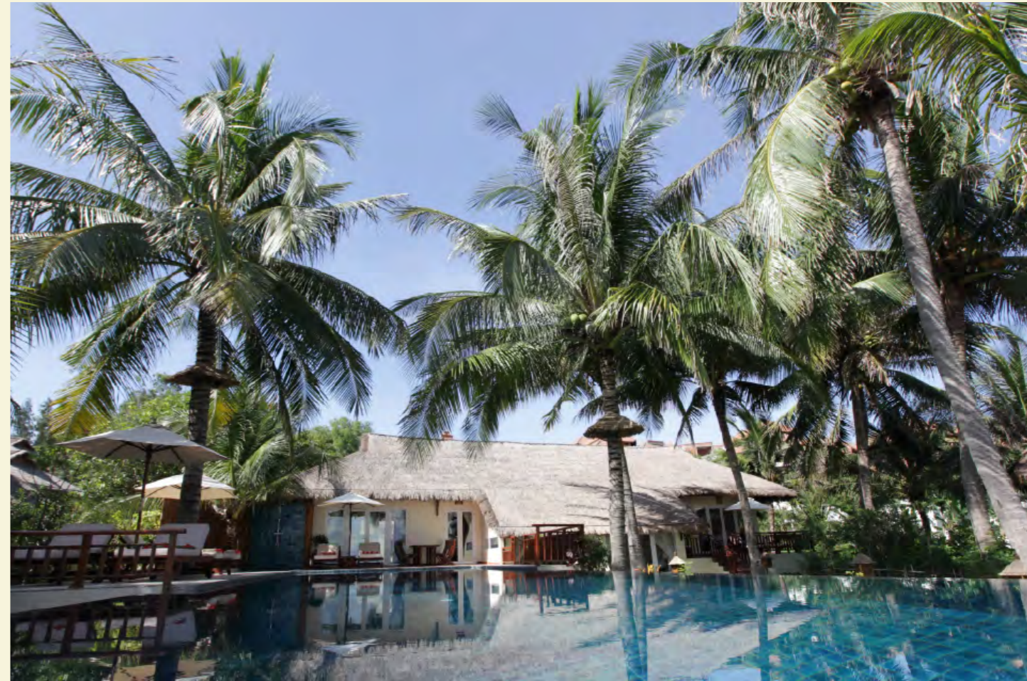
PRIVATE POOL VILLA

Km9, Phu Hai, Phan Thiet City, Binh Thuan Vietnam Tél: +84 62 3813 000 Fax: +84 62 3813 007 Email: resa.phanthiet@victoriahotels.asia