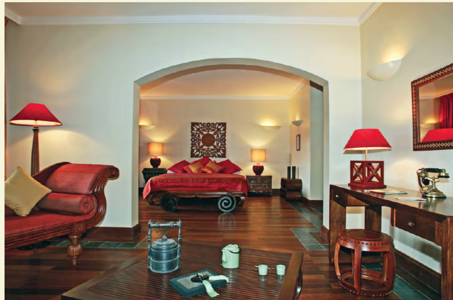
SUITE TA PHROM