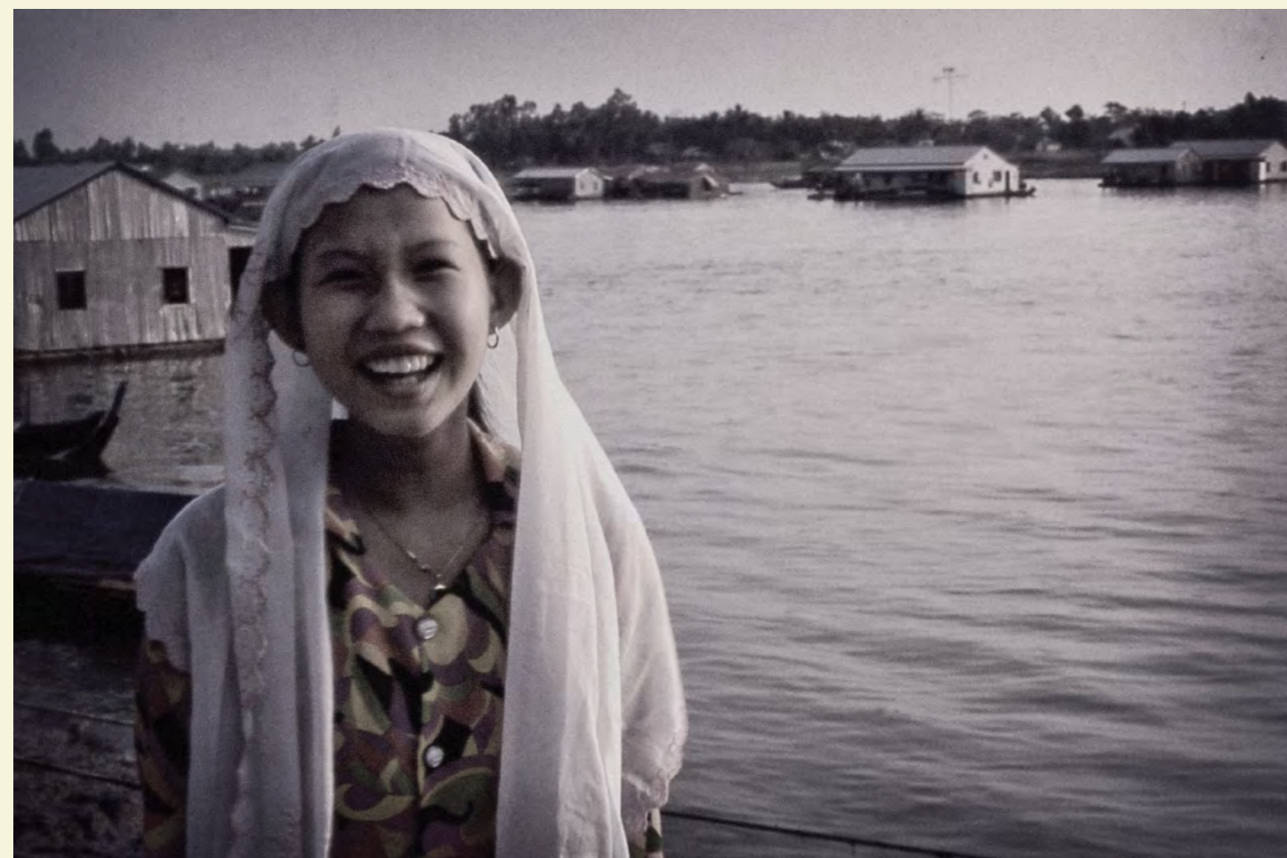
FERME D'ÉLEVAGE DE POISSONS