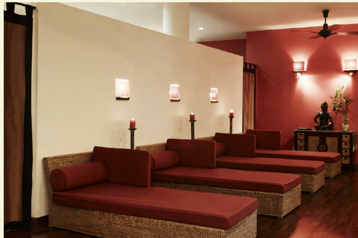
VICTORIA SPA SAPA