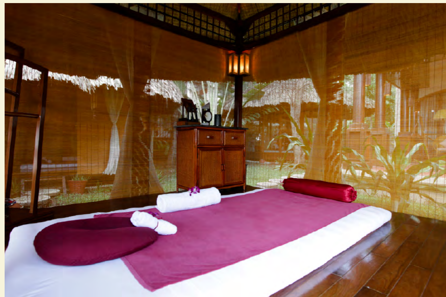
VICTORIA SPA CAN THO