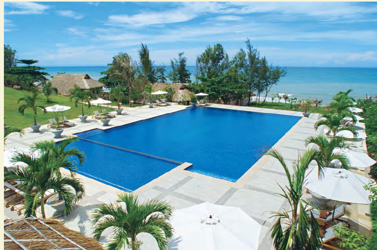
VICTORIA PHAN THIET BEACH RESORT & SPA

Km9, Phu Hai, Phan Thiet City, Binh Thuan Vietnam Tél: +84 62 3813 000 Fax: +84 62 3813 007 Email: resa.phanthiet@victoriahotels.asia