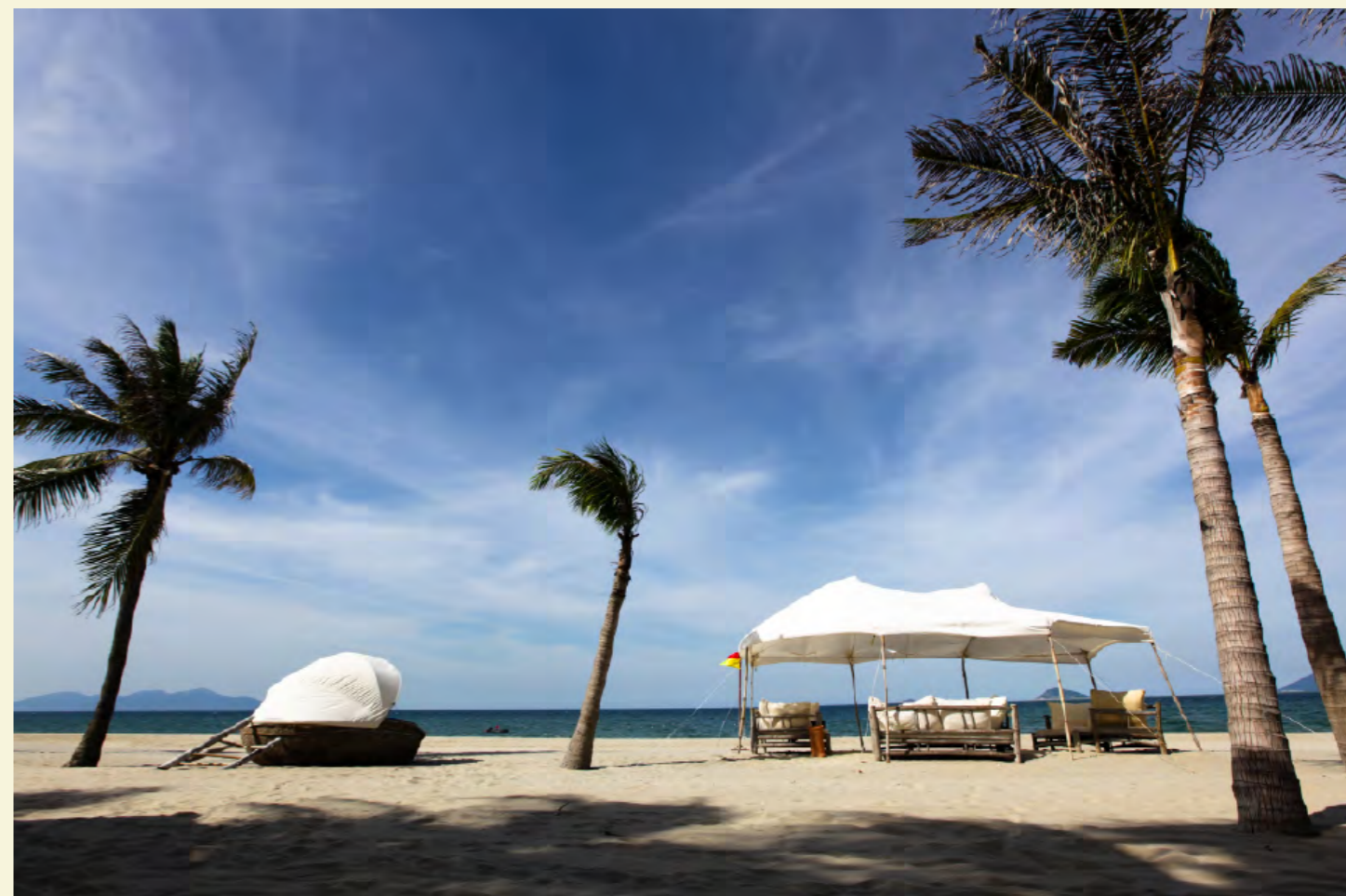
PLAGE À HOI AN