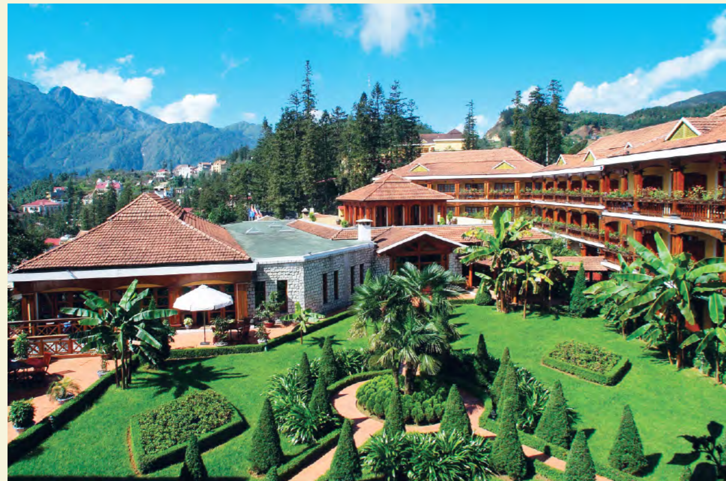
VICTORIA SAPA RESORT & SPA

Sapa District Lao Cai Province Vietnam Tél: +84 20 3871 522 Fax: +84 20 3871 539 Email: resa.sapa@victoriahotels.asia