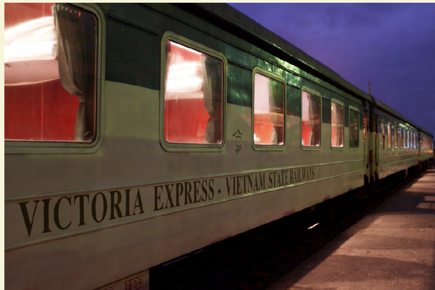
VICTORIA EXPRESS TRAIN