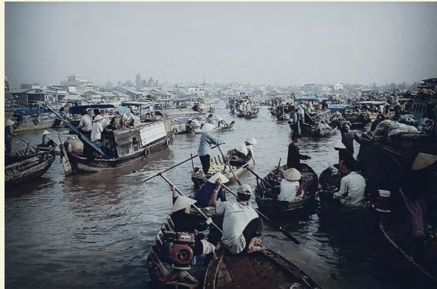
MARCHÉ FLOTTANT DE CAI RANG