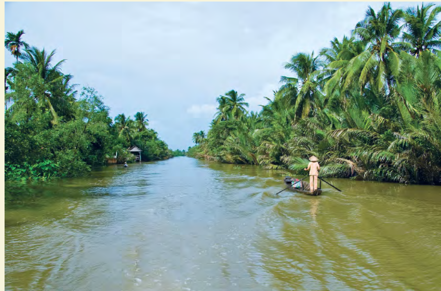
CANAL À CAN THO