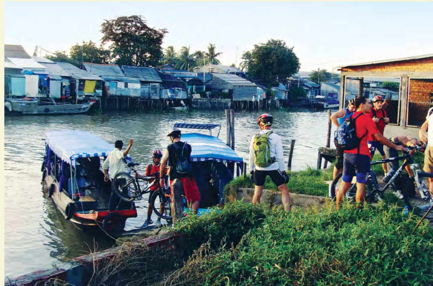
VTT À LA CAMPAGNE