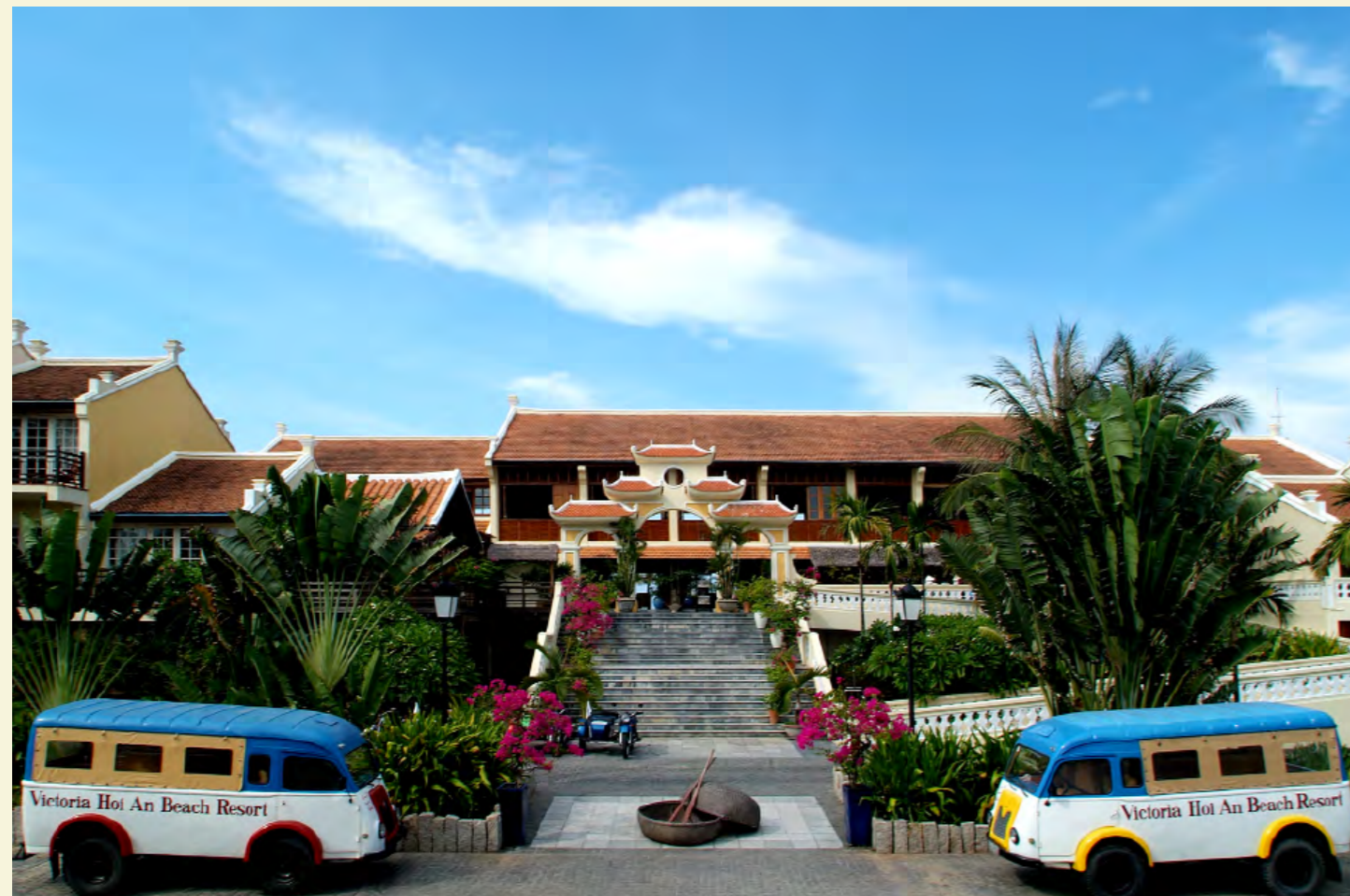
VICTORIA HOI AN BEACH RESORT & SPA

Cua Dai Beach, Hoi An Town Quang Nam Vietnam Tél: +84 510 3927 040 Fax: +84 510 3927 041 Email: resa.hoian@victoriahotels.asia