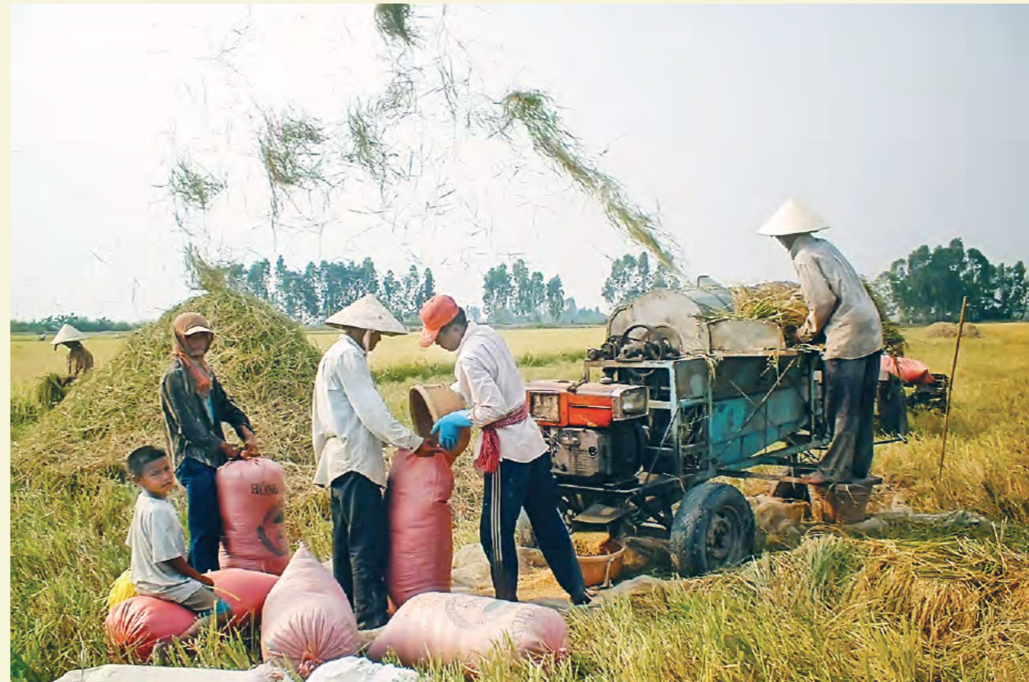
CHAMP À CAN THO