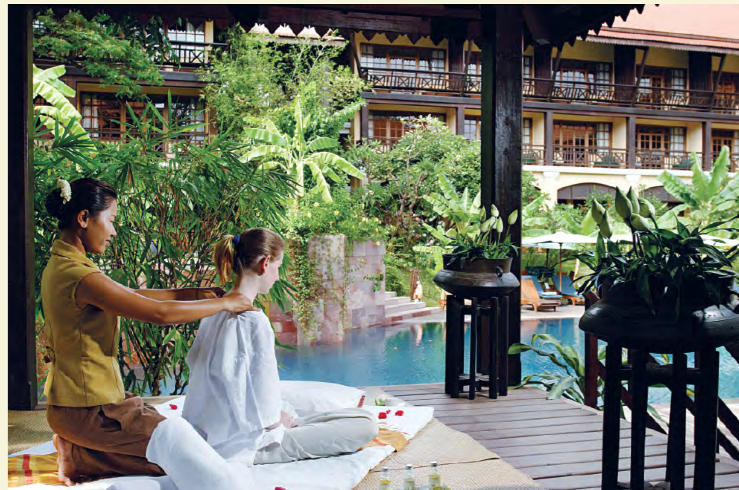
VICTORIA SPA ANGKOR