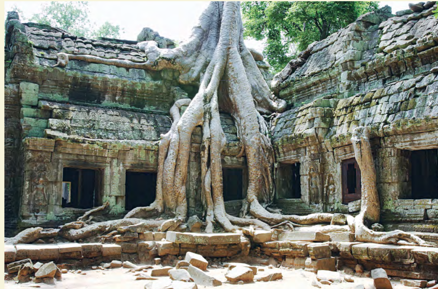
TEMPLE TA PHROM