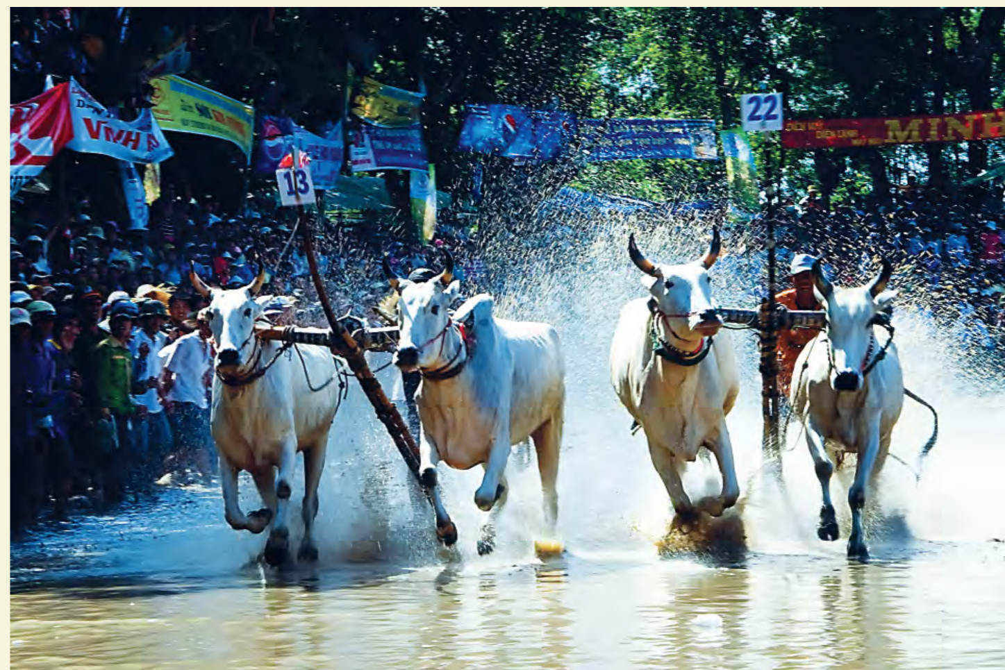
COURSE DE BUFFLES