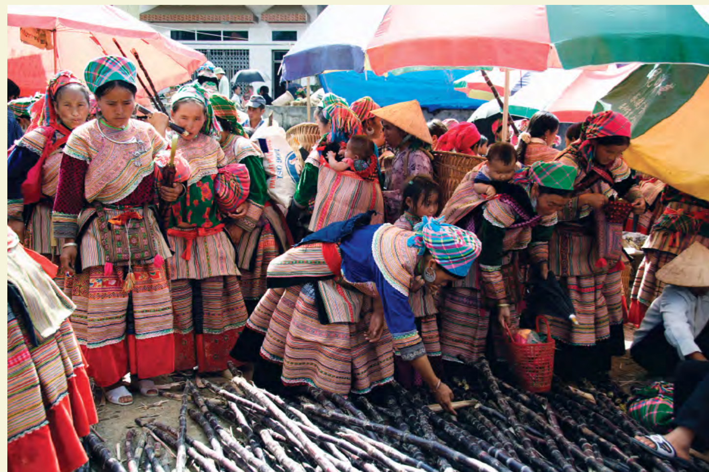
MARCHÉ À SAPA